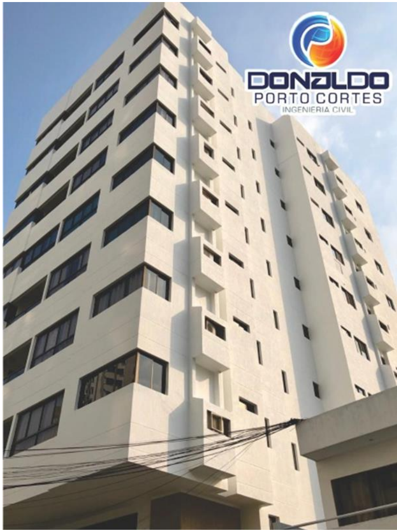
EDIFICIO CARIBE REAL