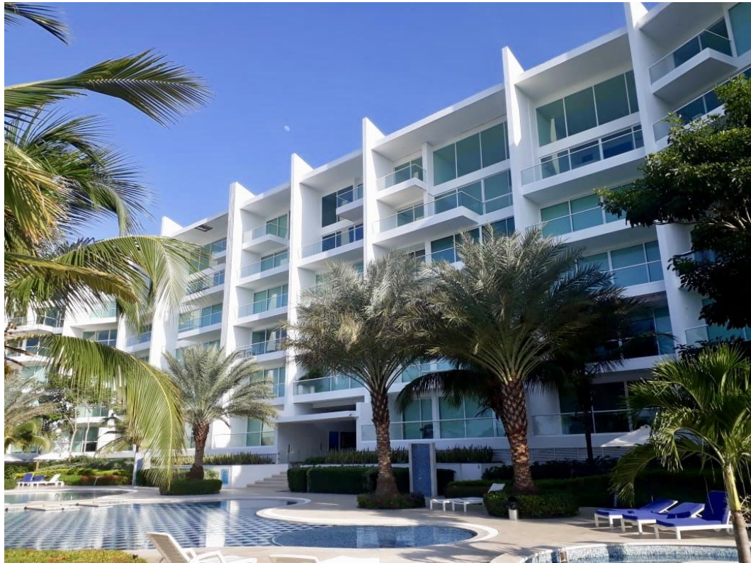
KARIBANA TORRE BAHIA