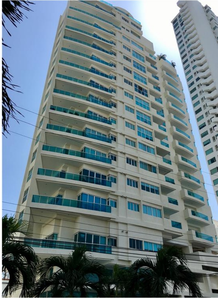
EDIFICIO BAHIA GRANDE