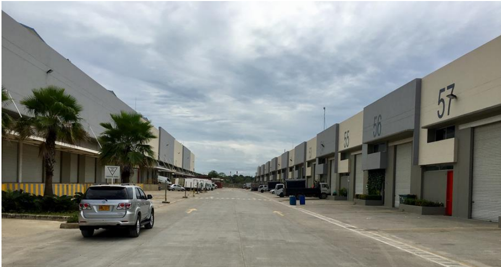
BODEGAS BLOC PORT