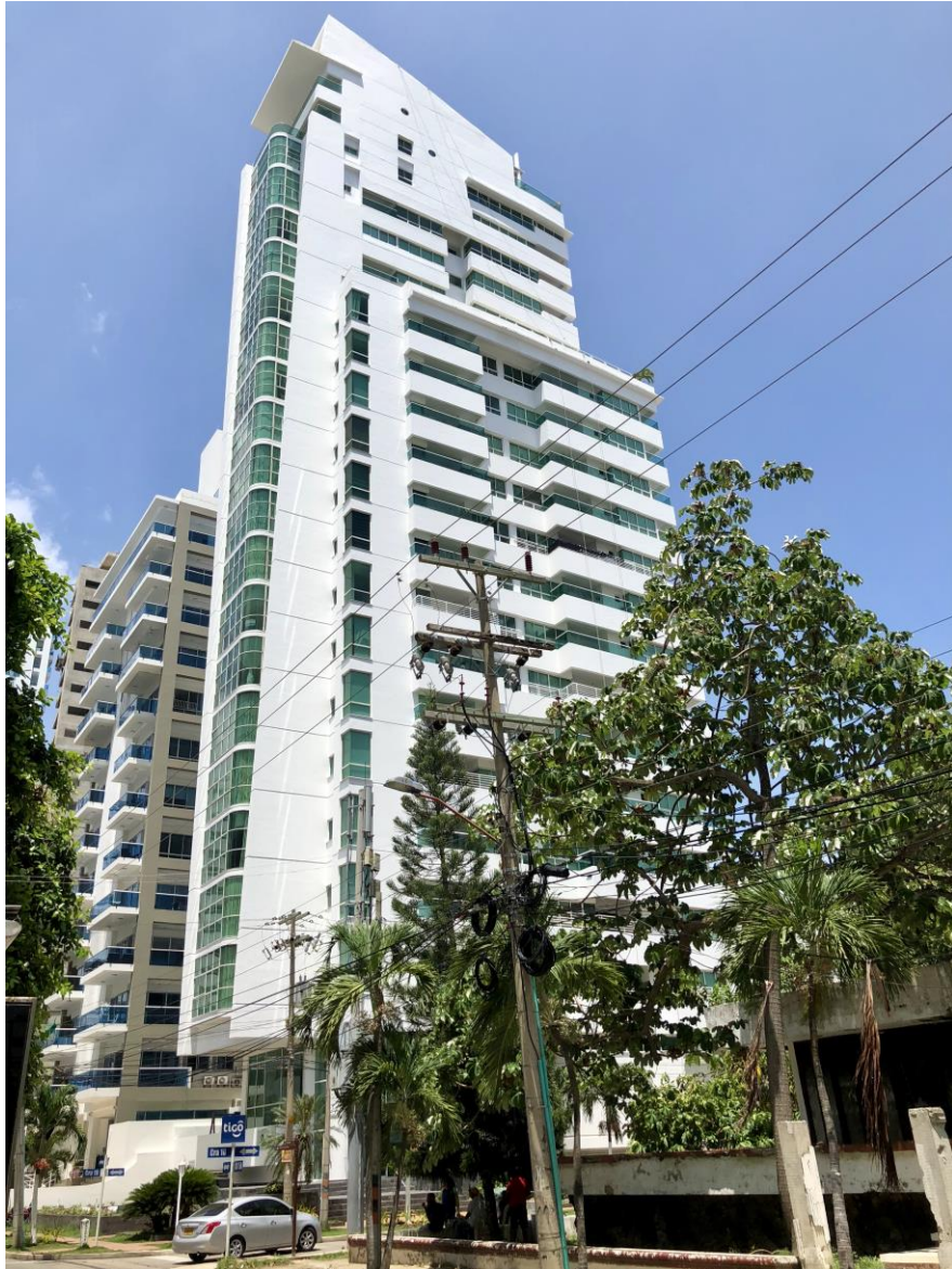
EDIFICIO OMEGA 21