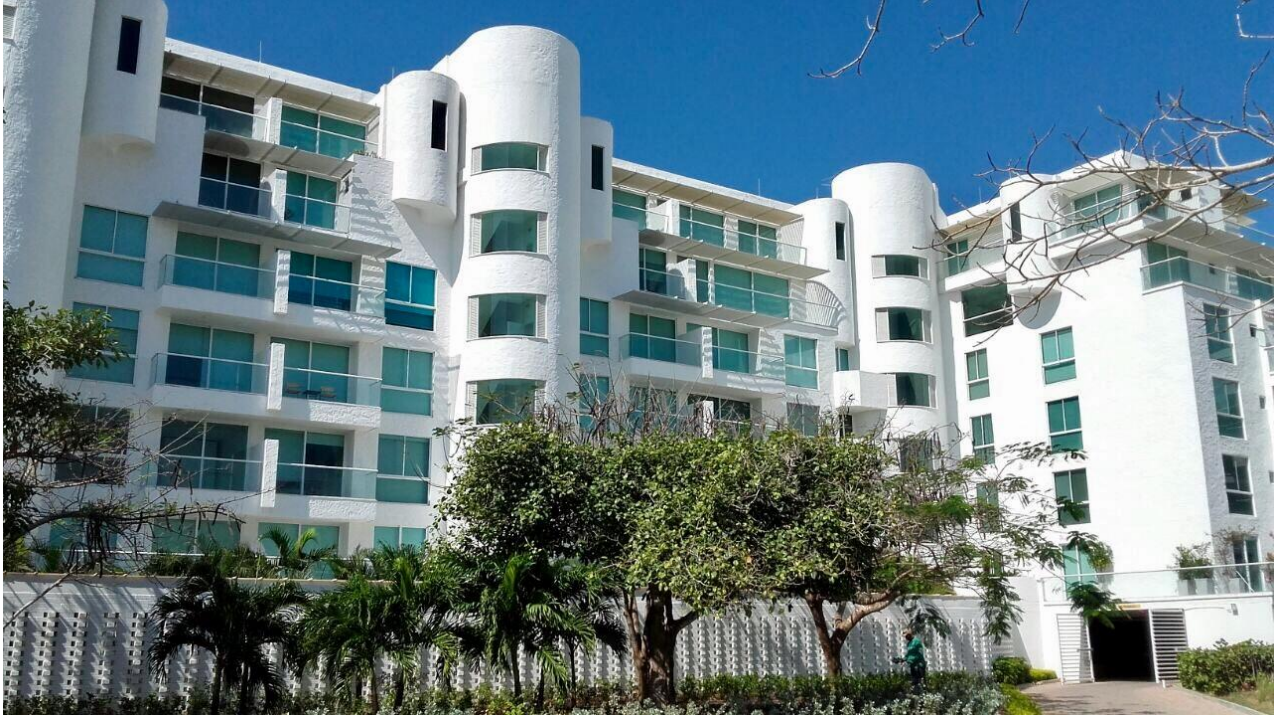
KARIBANA TORRE 1 Y 2